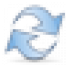
Figure 4 Обновить

Позволяет отобразить в отчете только определенные услуги. Множественный выбор. Для применения требуется нажать на кнопку “Обновить” справа.