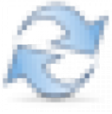
Figure 15 Обновить

При обновлении отчет будет перезагружен. Так же можно воспользоваться кнопкой “Применить фильтры из отмеченных полей”