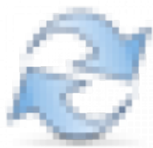
Figure 11 Обновить

Позволяет отфильтровать список услуг по специальности сотрудника, который оказал услугу. Так же ограничивает набор данных в фильтре “Сотрудник”. Множественный выбор. Для применения требуется нажать на кнопку “Обновить” справа.