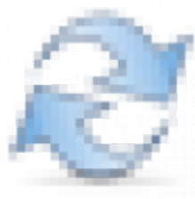
Figure 13 Обновить

При обновлении отчет будет перезагружен. Так же можно воспользоваться кнопкой “Применить фильтры из отмеченных полей”