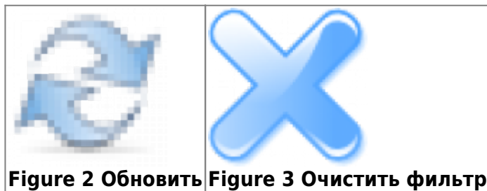
Figure 2 Обновить Figure 3 Очистить фильтр

Позволяет ввести часть наименования услуги или кода, для фильтрации отчета только по данной части наименования или коду услуги. Для применения требуется нажать на кнопку “Обновить” справа. Для сброса значения требуется нажать кнопку “Очистить фильтр” справа.